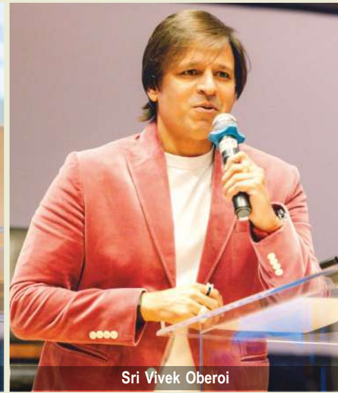
Sri Vivek Oberoi