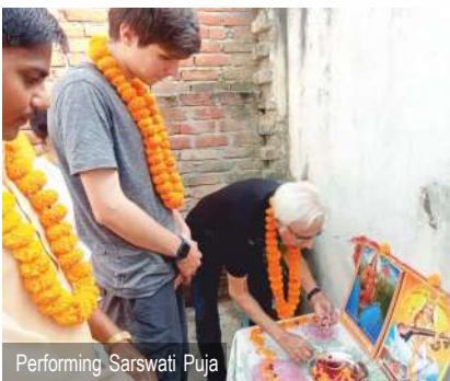
Performing Sarswati Puja