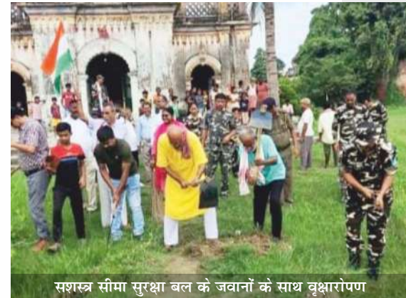
सशस्त्र सीमा सुरक्षा बल के जवानों के साथ वृक्षारोपण

अपने प्रवास के क्रम में मैं सीतामढ़ी अंचल के संच सुरसंड स्थित आईवीडी (इंटीग्रेटेड विलेज