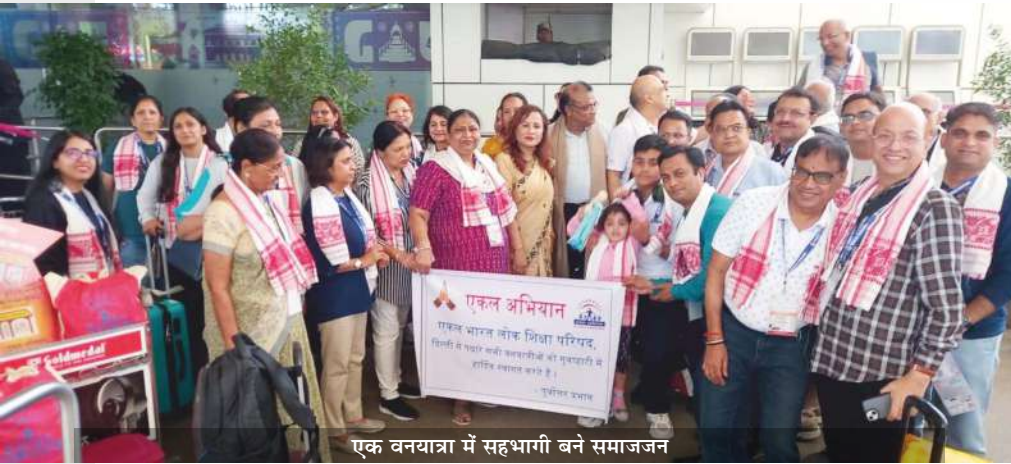
एक वनयात्रा में सहभागी बने समाजजन