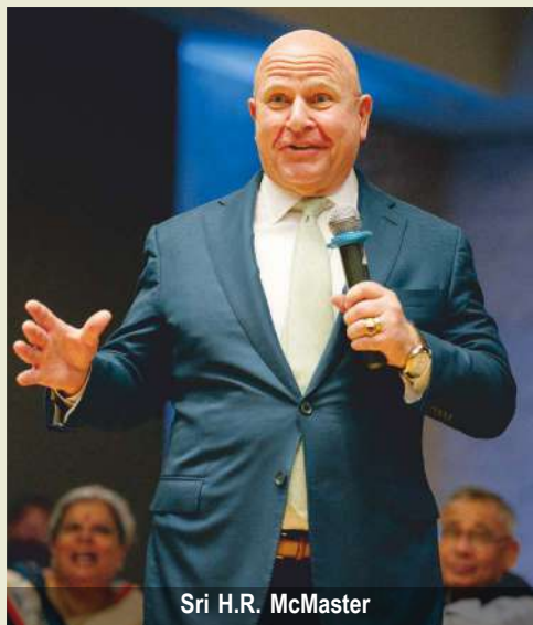
Sri H.R. McMaster