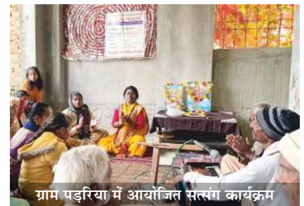
ग्राम पड़रिया में आयोजित सत्संग कार्यक्रम

वापसी की। गांव-गांव में होने वाले सत्संग बिहार के ग्रामीण क्षेत्रों में सामाजिक समरसता को बढ़ावा दे रहे हैं, जहाँ सभी ग्रामीण ऊंच-नीच और जाति की चिंता से एकजुटता से अपने आराध्य की अर्चना करते हैं।