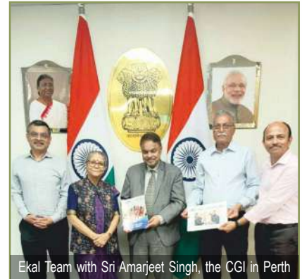
Ekal Team with Sri Amarjeet Singh, the CGI in Perth

During the launch event, Manju Didi delivered a presentation showcasing Ekal Abhiyan as a transformative national movement aimed at empowering rural and tribal villages in India through its five key verticals of functional education. The audience fully grasped the movement's importance in nation-building and was encouraged to visit India to witness the work of Ekal