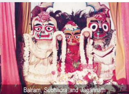
Balram, Subhadra and Jagannath