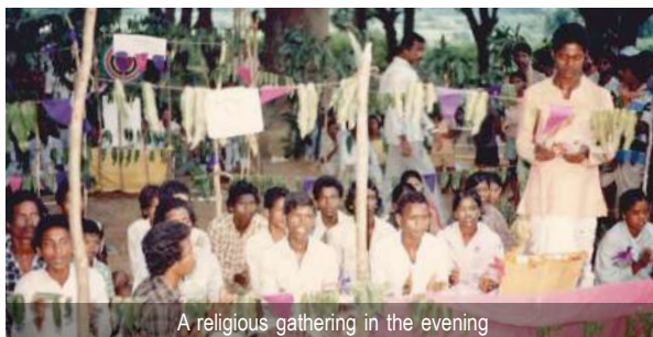
A religious gathering in the evening

consoled them, saying the Lord was resting after an arduous journey but would come soon. He added, 'However, there's a condition. Will you welcome Him?' 'Of course!' the villagers replied enthusiastically. Swami Ji explained, 'The Lord wishes to hear the Jagannath Bhagwat recited upon His arrival.'