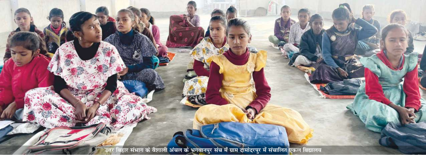
उत्तर बिहार संभाग के वैशाली अंचल के भगवानपुर संच में ग्राम दामोदरपुर में संचालित एकल विद्यालय

जिनमें 2,564 एकल विद्यालय चल रहे हैं। इनमें 39,546 बच्चे तथा 39,808 बच्चियां शिक्षा प्राप्त कर रही हैं। यहाँ भी बच्चियों की संख्या बच्चों से अधिक है। इस प्रकार कुल 79,354 विद्यार्थी एकल विद्यालयों के माध्यम से शिक्षित-संस्कारित हो रहे हैं। 59 एकल विद्यालयों में ई-शिक्षा आ चुकी है जहाँ टेबलेट से माध्यम से पढ़ाई करवाई जाती है। 1,620 संस्कार केंद्र तथा 02 रथ संभाग में संस्कारों की गंगा बहा रहे हैं। 27,335 पोषण वाटिकाओं सहित जैविक कृषि कर रहे 32,903 किसान तथा 38,793 गोपालक कृषक परिवार एकल के माध्यम से कार्यान्वित हो चुके हैं। 02 आईवीडी केंद्र स्वावलंबन को बढ़ावा दे रहे हैं, जिनके विषय में विस्तार से आप इस कवर स्टोरी में पढ़ेंगे।