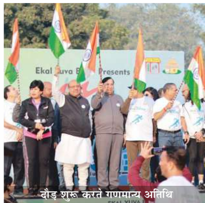
दौड़ शुरू करते गणमान्य अतिथि