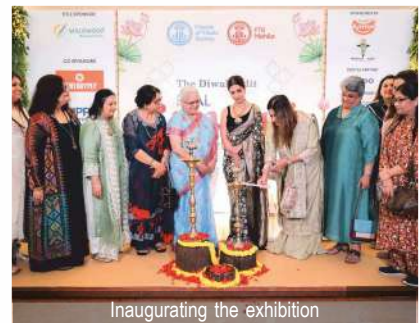
Inaugurating the exhibition

The event received generous support from sponsors, including Willowood Chemical, Century Plyboards, Skipper Limited, Manaksia Limited, Anmol Industries, and Tropical Agrosystem. The dedicated organizing committee, along with the support of the Yuva wing, played a key role in the