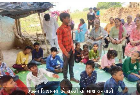
एकल विद्यालय के बच्चों के साथ वनयात्री