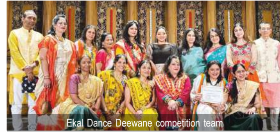
Ekal Dance Deewane competition team

Kudos to the Boston team and all the performers for making this event a resounding success! The spirit of unity