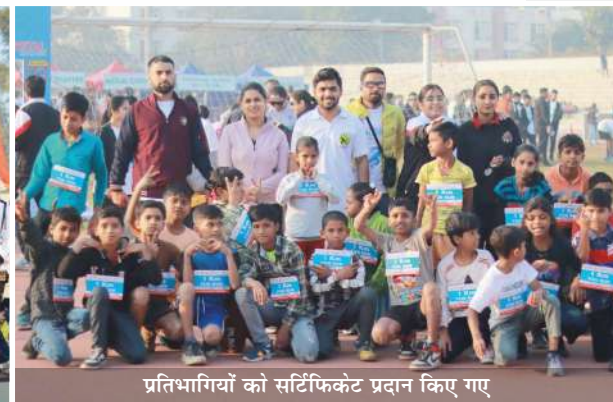
प्रतिभागियों को सर्टिफिकेट प्रदान किए गए