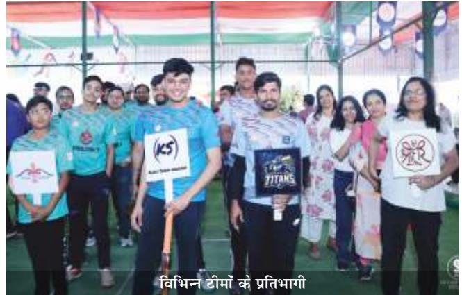
विभिन्न टीमों के प्रतिभागी

एकल श्रीहरि सूरत युवा समिति द्वारा दो दिवसीय बॉक्स क्रिकेट टूर्नामेंट का आयोजन सीबी पैलेस ग्राउंड में किया गया। टूर्नामेंट में कुल 40 टीमों ने भाग लिया, जिनमें 24 टीम पुरुषों की, 8 टीम महिलाओं की और 8 टीम बच्चों की थी।