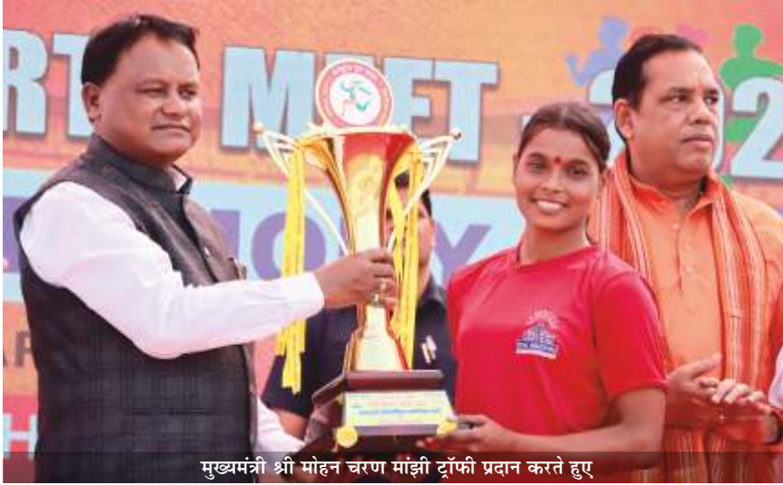
मुख्यमंत्री श्री मोहन चरण मांझी ट्रॉफी प्रदान करते हुए