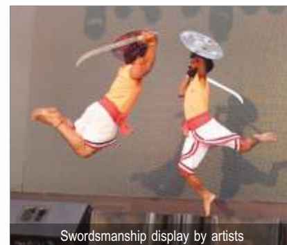
Swordsmanship display by artists