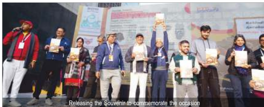
Releasing the Souvenir to commemorate the occasion