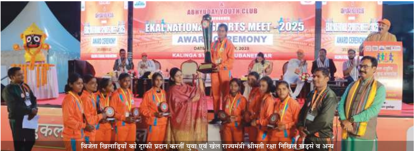
विजेता खिलाड़ियों को ट्रॉफी प्रदान करती युवा एवं खेल राज्यमंत्री श्रीमती रक्षा निखिल खड़से व अन्य