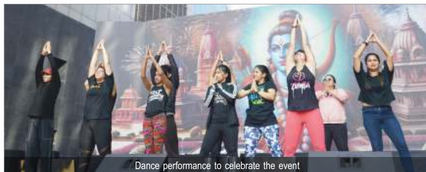
Dance performance to celebrate the event