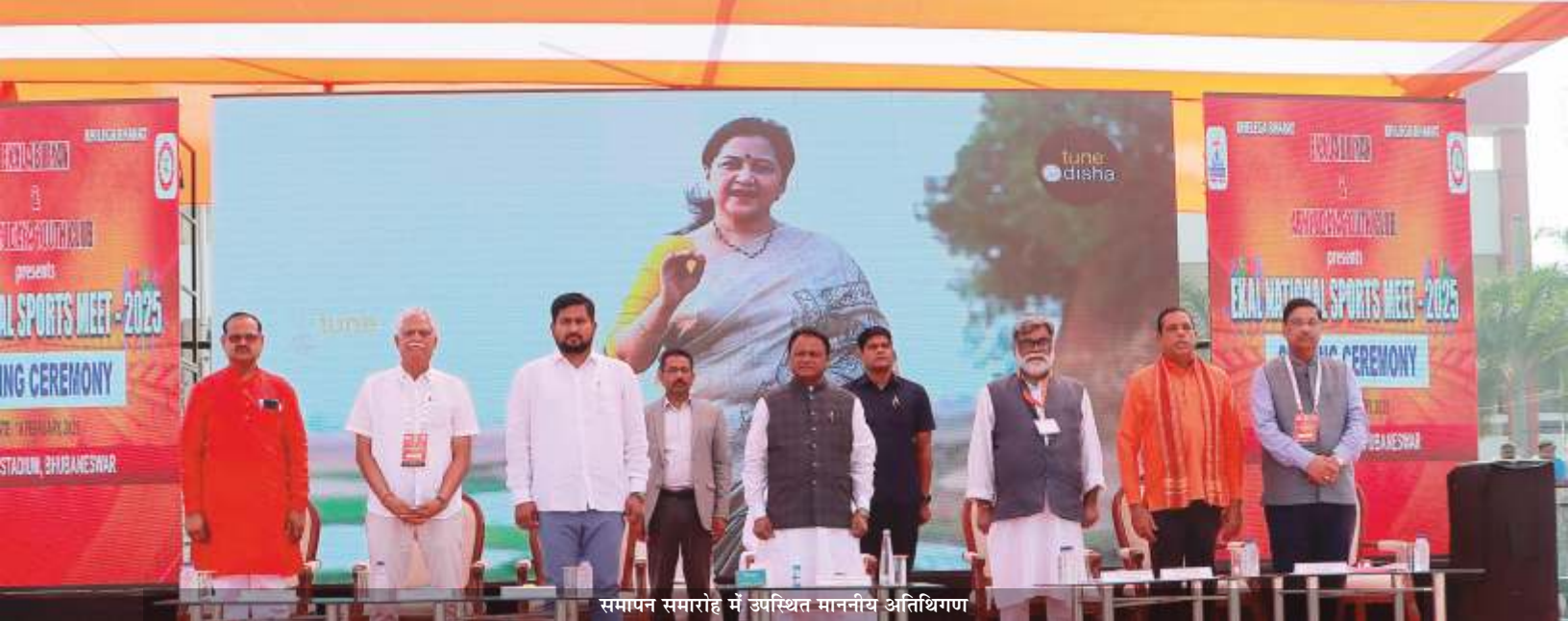
समापन समारोह में उपस्थित माननीय अतिथिगण