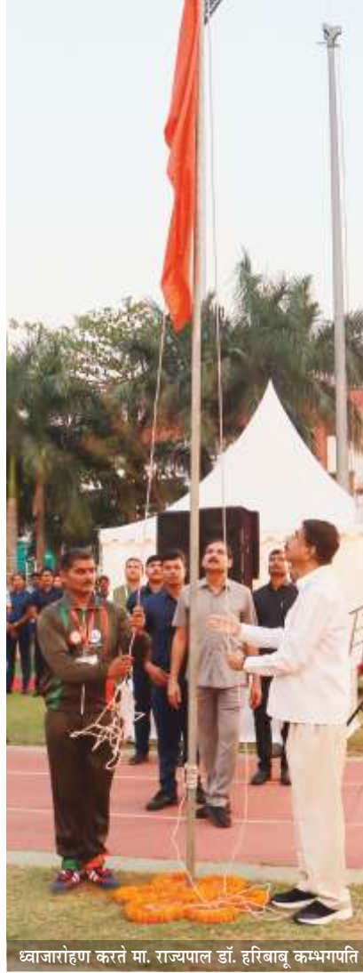
ध्वजारोहण करते मा. राज्यपाल डॉ. हरिबाबू कम्भगपति

गत 35 वर्षों से स्वामी विवेकानंद के प्रेरणास्पद विचारों पर कार्य कर रहे एकल अभियान ने ग्रामीण बच्चों के बीच शिक्षा-संस्कार के नए नवाचार किए हैं। स्वामी विवेकानंद खेलों के प्रति विशेष रुचि रखते थे। स्वामीजी का मानना था कि जीवन सफल होने के साथ सार्थक भी होना चाहिए। भारत के युवाओं को लेकर उनका सपना था, कि वे अपने लक्ष्यों को हासिल करने के लिए निर्भय बनें तथा शारीरिक-मानसिक रूप से मजबूत हों। इसके लिए स्वामी विवेकानंद खेलों के माध्यम से जीवन को समझने और जीवन जीने की बात करते थे। इसी भाव से प्रेरणा लेकर एकल अभियान ने अभ्युदय यूथ क्लब द्वारा विभिन्न स्तरों पर खेलकूद समारोह के आयोजन की रूपरेखा बनाई, जिसका यह सफलतम तीसरा वर्ष रहा। पहले लखनऊ, फिर नागपुर और इस बार भुवनेश्वर में एकल राष्ट्रीय खेलकूद प्रतियोगिता के आयोजन ने नए कीर्तिमान स्थापित किए हैं। भुवनेश्वर स्थित कलिंगा स्टेडियम में विभिन्न पारंपरिक खेलों में एकल अभियान से जुड़े