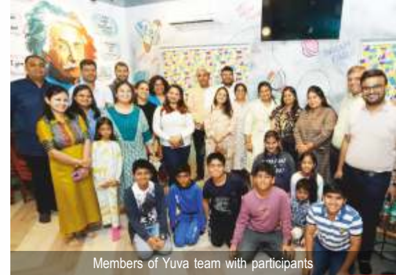
Members of Yuva team with participants

The much-anticipated orientation programme, Hamari Sanskriti Hamari Dharohar, organized by FTS Yuva Samiti, Kolkata Chapter, for FTS Gurukul, was successfully conducted on February 1, 2025, at The Logical Lamp, Kolkata. The event witnessed an overwhelming response from both parents and students, with 25 attendees engaging in a meaningful exploration of India's rich cultural heritage.