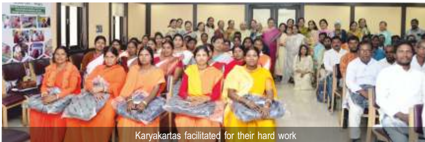
Karyakartas facilitated for their hard work

The event was a resounding success, celebrating the dedication and efforts of the Karyakartas while fostering a sense of unity and encouragement within the community.